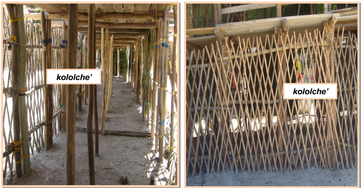
Figura 2. La estructura de las celosías de un palco. A la izquierda se ve el kololche' desde el interior de la planta baja del palco, a la derecha se aprecia desde la parte externa.

El juez de plaza decide si debe recibir el koloxche 25 , que le dicen, para poner, como hay esa corrida de postín, que esos toros que son de lidia, porque cuando meten los toros de la región, no es tanto, que diga, no es peligro porque están andando aquí ponen la capa, entran para la lidia. Cuando salen los toros del lunes, los toros, esos sí son toros de casta, es donde está el peligro, porque ellos vienen con fuerza y chocan con las maderas, pos así de años anteriores, atrás, la gente está ahí abajo, un accidente puede ocurrir 26 .