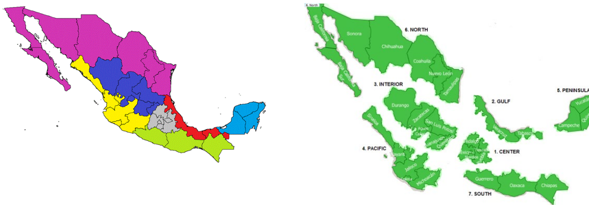
Figura 1 Siete regiones geográficas de México

Notas: Las regiones se describen a continuación: