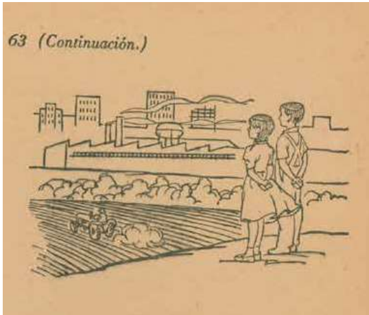
“Ejercicio número 63” (Barrón, 1960a: 223)