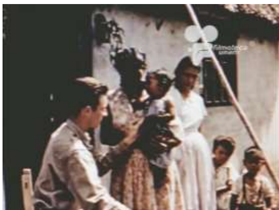
Fotograma 3 Cruzada Heroica (1960)