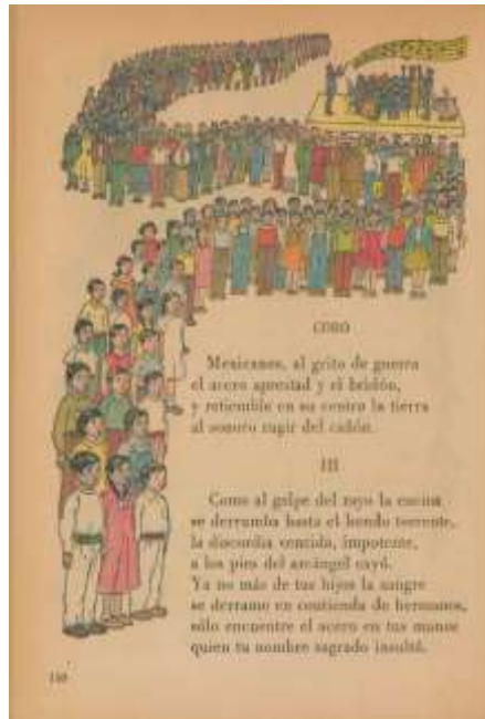
“Himno nacional mexicano” (Galicia, 1960b: 110)