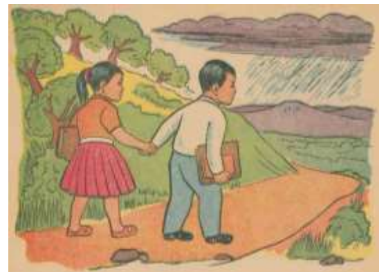
“A los niños de mi patria” (Domínguez y León, 1961: 186)