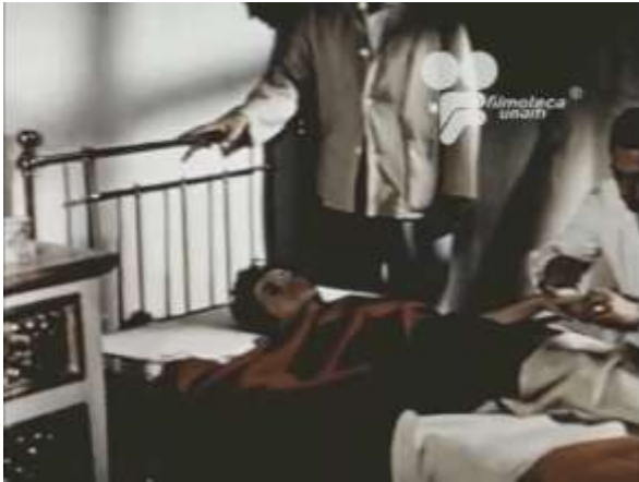
Fotograma 6 Cruzada Heroica (1960)