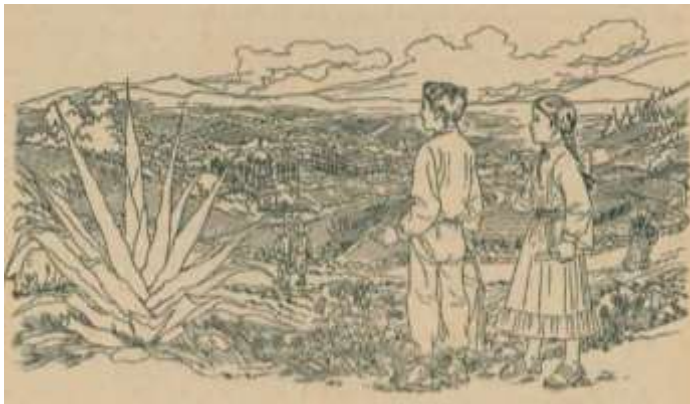
“La patria y sus símbolos” (Monroy, 1966: 210)