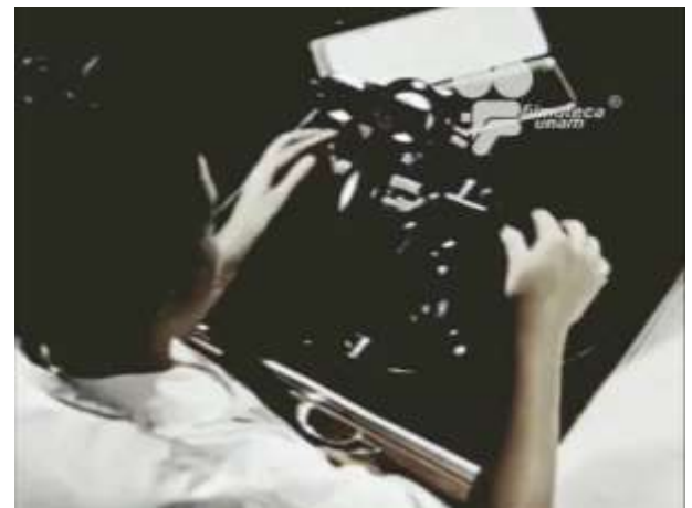
Fotograma 9 Cruzada Heroica (1960)