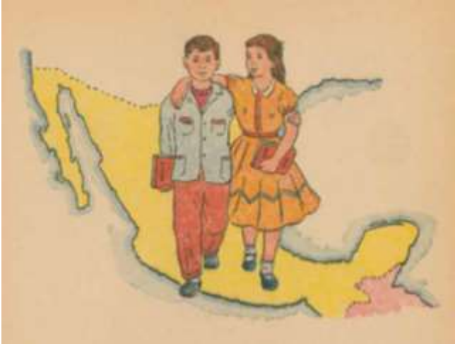
“Amigos de tercer año” (Cárabes, 1960b: 7)