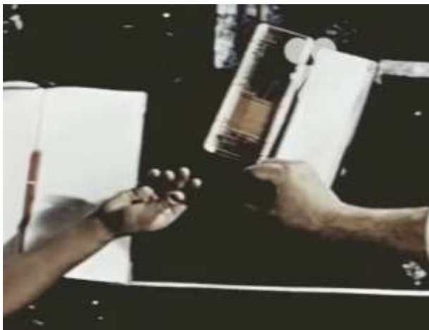
Fotograma 8 Cruzada Heroica (1960)