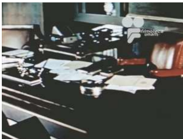
Fotograma 1 Cruzada Heroica (1960)