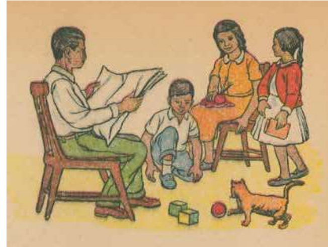
“Una familia feliz” (Cárabes, 1960b: 62)