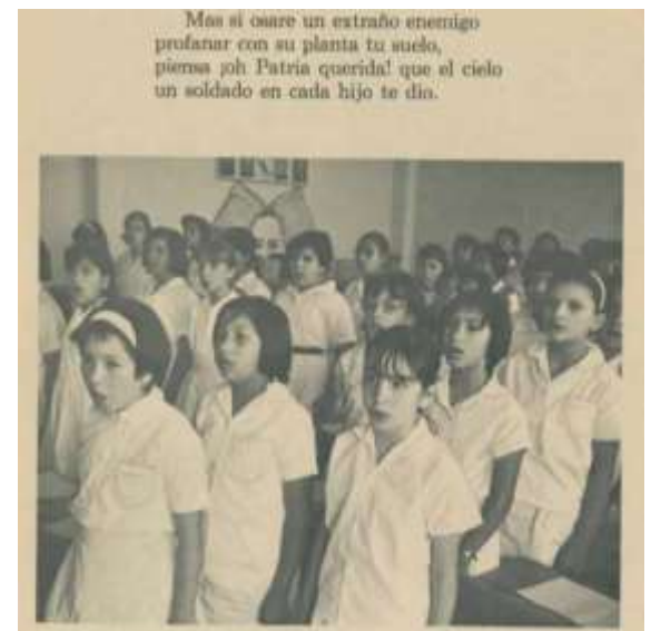
“Himno nacional mexicano” (Norma, 1968b: 180)