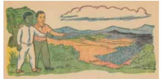
“La patria” (Domínguez y León, 1961: 172)