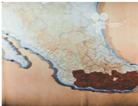
Fotograma 5 Cruzada Heroica (1960)