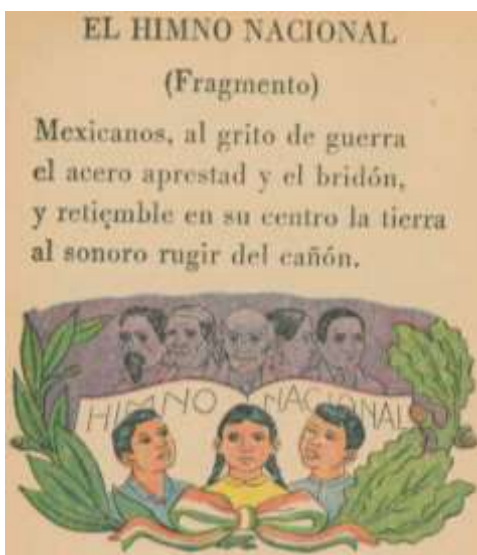
“El himno nacional” (Domínguez y León, 1961: 180)