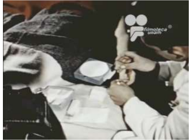
Fotograma 7 Cruzada Heroica (1960)