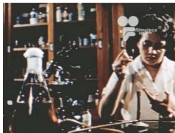
Fotograma 4 Cruzada Heroica (1960)