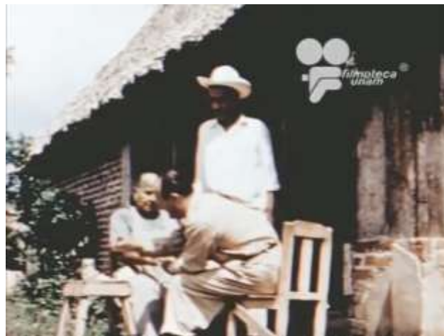
Fotograma 2 Cruzada Heroica (1960)