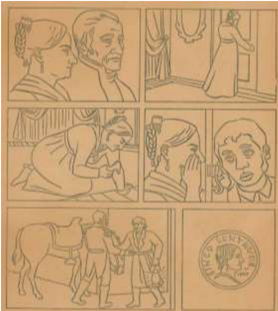
“Josefa Ortiz de Domínguez” (Domínguez y León, 1960a: 209)